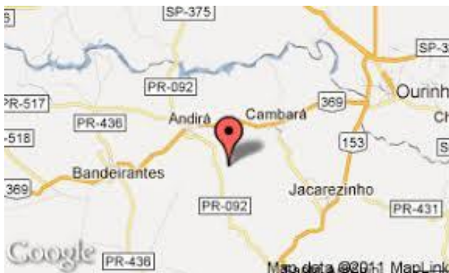
Figura 1 – Localização de Barra do Jacaré

O município de Barra do Jacaré, emancipado em 19 de dezembro de 1964, localiza-se na região do Norte Pioneiro do Estado do Paraná, sendo sua posição dada por Latitude de 23° 06' 54" Sul, Longitude de 50° 10' 53" Oeste e Altitude de 560 metros (IBGE). Possui como Municípios Limítrofe Andirá, Cambará, Jacarezinho, Santo Antônio da Platina e Bandeirantes. Compreende uma área de 115,72 Km 2 (ITCG). A distância de Barra do Jacaré até a Capital Curitiba é de 391,55 Km (SETR). Desse total, compreende-se como área urbana aproximadamente 2,05 Km 2 , ou seja, 1,77% do território municipal. Já a área rural, possui aproximadamente 113,67 Km 2 , ou seja, 98,23% do território municipal.